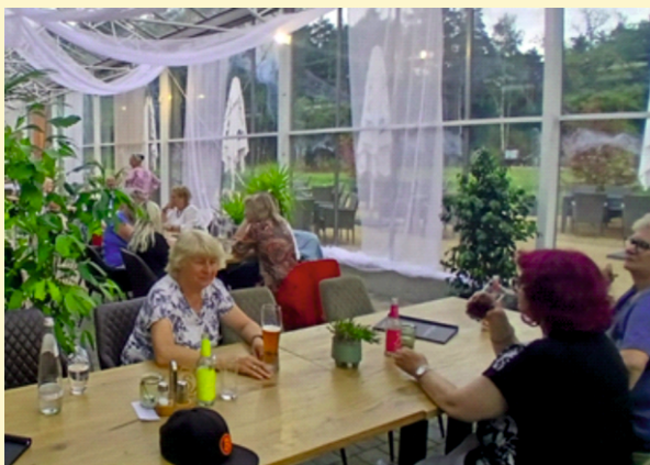
Sommerfest „Garten Eden“ in Halbendorf