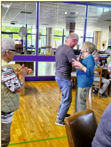
Frühlingsfest „Brauwerk“ in Schleife