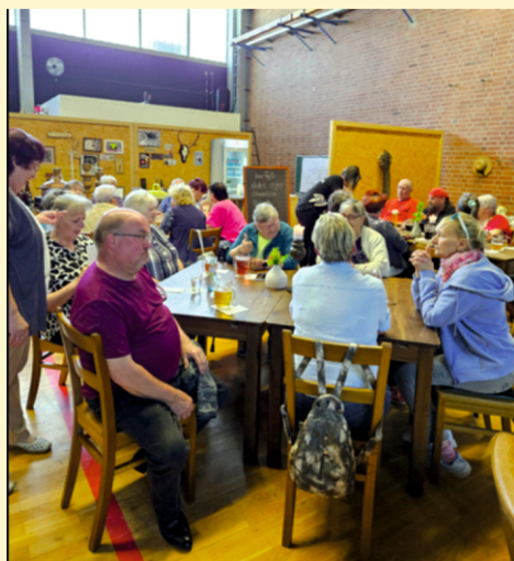
Frühlingsfest „Brauwerk“ in Schleife